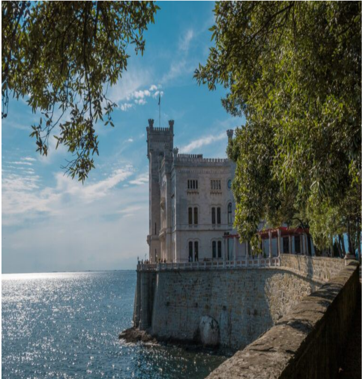
IL CASTELLO DI MIRAMARE CHE DOMINA IL GOLFO DI TRIESTE